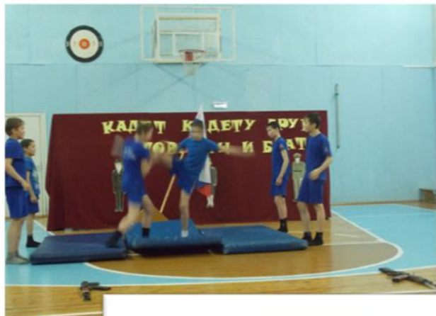
Элементы рукопашного боя