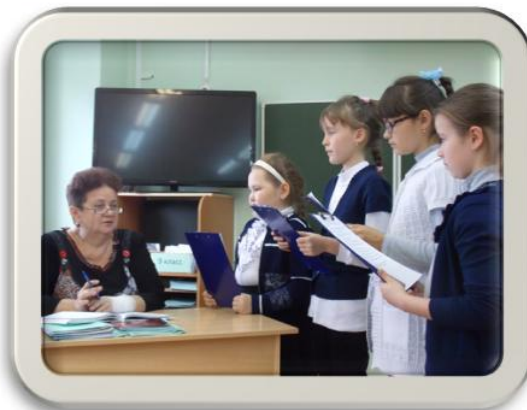
Юные экскурсоводы берут интервью.