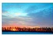
БОЛЬШАЯ ХА- ДЫРЬ-ЯХА